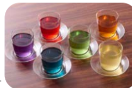
白井製茶さま 緑茶フレーバーティー