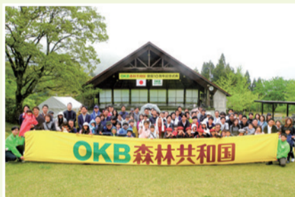
▲参加したOKBグループ役員ら

OKBは2015年5月、岐阜県および揖斐川町と「OKB森林共和国」における恵みの森林づくり協定」を締結するとともに、同年6月に「OKB森林共和国」を建国し、森林再生に向けた取り組みや地域交流活動を行ってきました。当日は、OKBグループ役員やその家族など、約130名が参加し、植樹活動や木工体験などを実施しました。