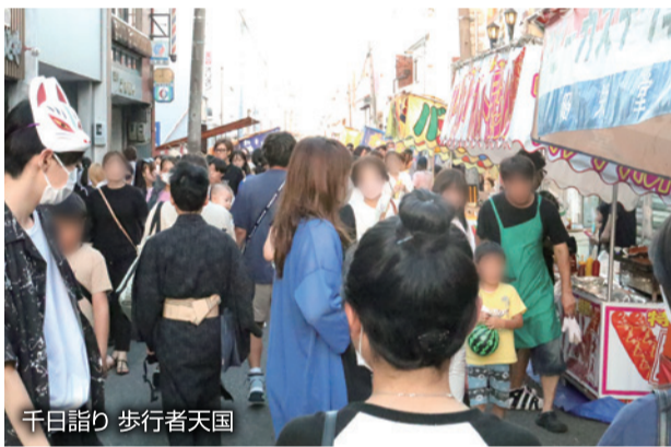
千日詣り 歩行者天国

「千日詣り 歩行者天国」千日詣りは、美濃の正倉院とも称される「円鏡寺」で、毎年8月10日に行われます。この日に参拝すると、千日参拝したのと同じ御利益があるとされており、多くの参拝者が訪れます。同日に開催される北方町商工会による歩行者天国では、町内商店街の通りに露店やキッチンカーが立ち並び、毎年多くの方々がお楽しみされています。