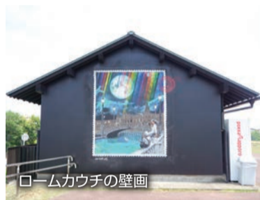
ルームカウチの壁画

とした芝生広場のほか、子ども用遊具や散策路、サイクリングロードなどが整備され、週末には家族連れなどで賑わいます。春には桜が咲き誇り、県内有数のお花見スポットとしても人気があります。最近では新たな写真スポットとして、枝葉の形がハートに見えることから名づけられた「ハートの木」（見頃：5〜9月ごろ）や、ストリートアーティ