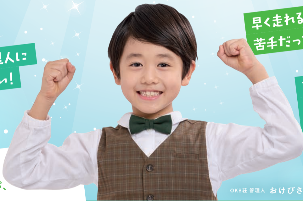
OKB 荘 管理人 おけびさん

2026年3月9日に 創立130周年を迎えるOKBが、 日頃のご愛顧への感謝として、 皆さまの「叶えたい夢や願いごと」の 実現をサポートします!