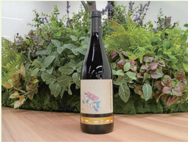
▲ドメヌ・レゾン 中富良野産ツヴァイゲルトレーベ 樽選抜 #2/19 2024

OKBは、地域企業や団体の社会貢献への想いをつなぐ場として、障がいのあるアーティストと地域企業が協働して商品を生み出す「トモニアートプロジェクト」を2022年2月から推進しています。この取り組みでは、賛同企業の商品やサービスにアーティストの作品を取り入れ、収益の一部をアーティストへ還元することで、障がい者の社会参加や創作活動の輪を広げています。また、トモニアートの作品は多様な商品パッケージや空間デザインなどに活用されており、障がいのあるアーティストがその才能を発揮し、社会で輝く機会となっています。11月20日には、第12弾商品として、藤桂京伊株式会社によるワイン「ドメヌ・レゾン 中富良野産 ツヴァイゲルトレーベ 樽選抜 #2/19 2024」の商品化を新たにサポート。この商品は、「酒やビヅ」を展開する同社のワインバイヤーが北海道空知郡中富良野町にあるワイナリーからポトリングした限定品で、ポトルラベルに大垣市出身のアーティスト「J.O. (荻下丈)」さんの作品を採用しました。