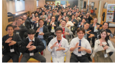
▲出席者による記念撮影