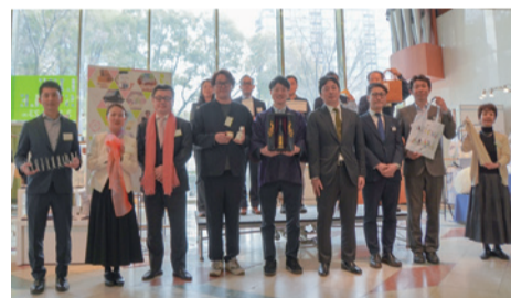
▲地域事業者との記念撮影