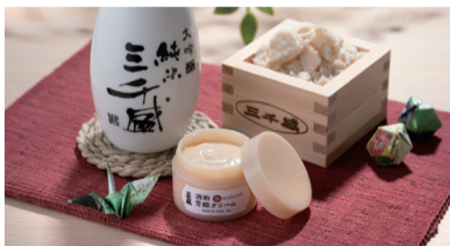
▲酒粕芳醇クリーム