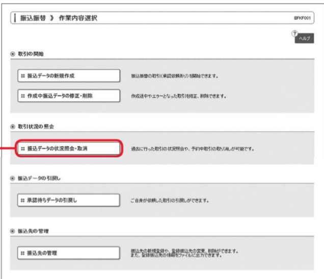
振込データの状況照会・取消

「振込振替」メニューをクリックしてください。作業内容選択画面が表示されますので、「振込データの状況照会・取消」ボタンをクリックしてください。