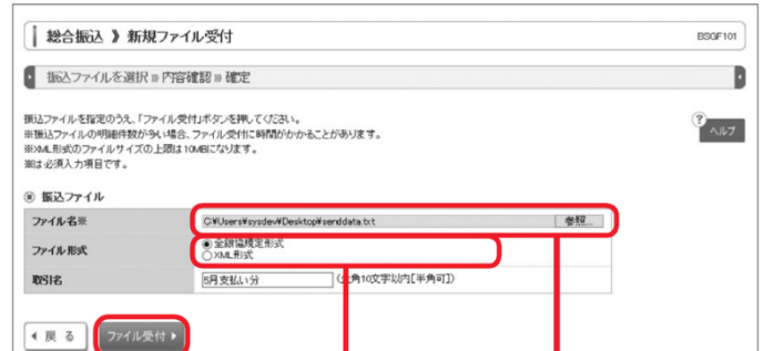
ファイル受付 ファイル形式 ファイル名

新規ファイル受付画面が表示されますので、「ファイル名(参照より選択)」「(任意で「取引名」)を入力し、ファイル形式を選択後、「ファイル受付」ボタンをクリックしてください。