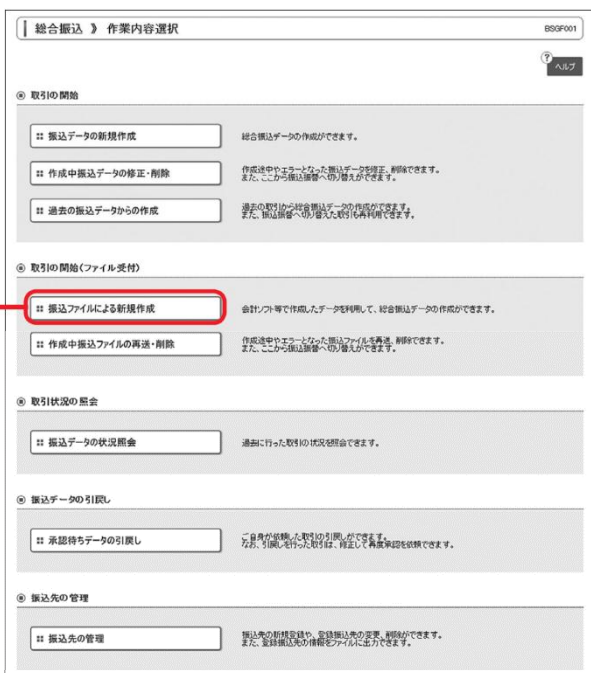
振込(納付)ファイルによる新規作成

作業内容選択画面が表示されますので、「振込(納付)ファイルによる新規作成」ボタンをクリックしてください。