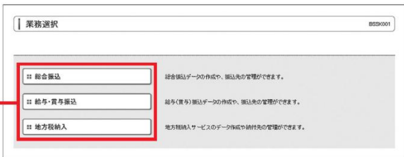
総合振込、給与・賞与振込、地方税納入

「データ伝送サービス」メニューをクリックしてください。続いて業務選択画面が表示されますので、「総合振込」「給与・賞与振込」「地方税納入」のいずれかのボタンをクリックしてください。